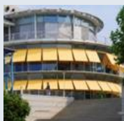
Schenck Technologie- und Industriepark

Leitung und Mit-Gründung des Instituts für angewandte Vertrauensforschung in Stuttgart; Lehrbeauftragte an der FOM und HTWG Konstanz; mehrjährige Tätigkeit im Bereich Beratung und Training in Deutschland; mehrjähriger Aufenthalt in Indonesien: Tätigkeit in der Entwicklungszusammenarbeit; Tätigkeit im Bereich Training und Beratung für Non-for-Profit- und profitorientierte Unternehmen; Lehre und Forschung, u.a. an der Katholischen Universität Atma Jaya; Studium der Soziologie, Philosophie und Psychologie; Promotion im Fach "Interkulturelle Kommunikation" an der TU Chemnitz